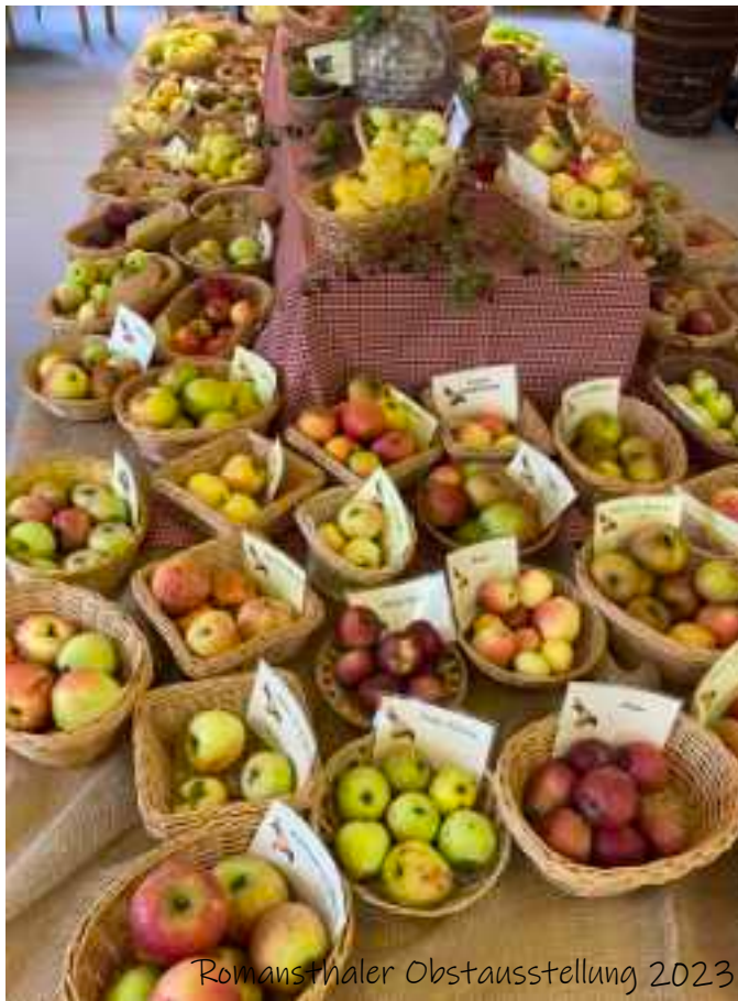
Romansthaler Obstausstellung 2023

1908 wurde von 17 Ortsvereinen der Lichtenfelser Bezirksverband für Obstbau gegründet, heute Kreisverband für Gartenbau und Landespflege. Auch alle anderen Vereine nannten sich früher „Obstbauvereine“. Ihre Hauptaufgabe war also, Theorie und Praxis der Obstbaumzucht und der Verwertung des Obstes der Bevölkerung zu vermitteln. Heute ziehen die Apfelmärkte wieder viele Besucher an, wengleich sich die Vereine natürlich längst auch anderen Aufgaben widmen.