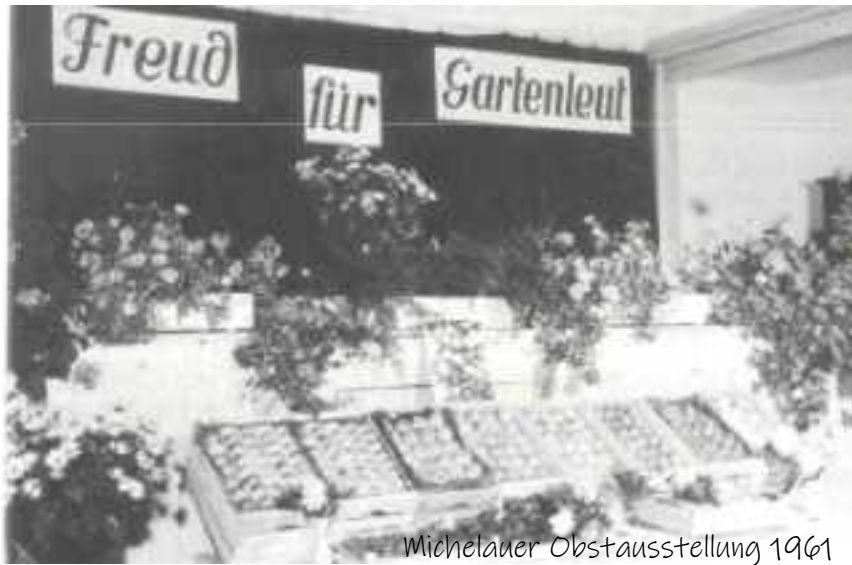
Michelauer Obstausstellung 1961

1908 wurde von 17 Ortsvereinen der Lichtenfelser Bezirksverband für Obstbau gegründet, heute Kreisverband für Gartenbau und Landespflege. Auch alle anderen Vereine nannten sich früher „Obstbauvereine“. Ihre Hauptaufgabe war also, Theorie und Praxis der Obstbaumzucht und der Verwertung des Obstes der Bevölkerung zu vermitteln. Heute ziehen die Apfelmärkte wieder viele Besucher an, wengleich sich die Vereine natürlich längst auch anderen Aufgaben widmen.