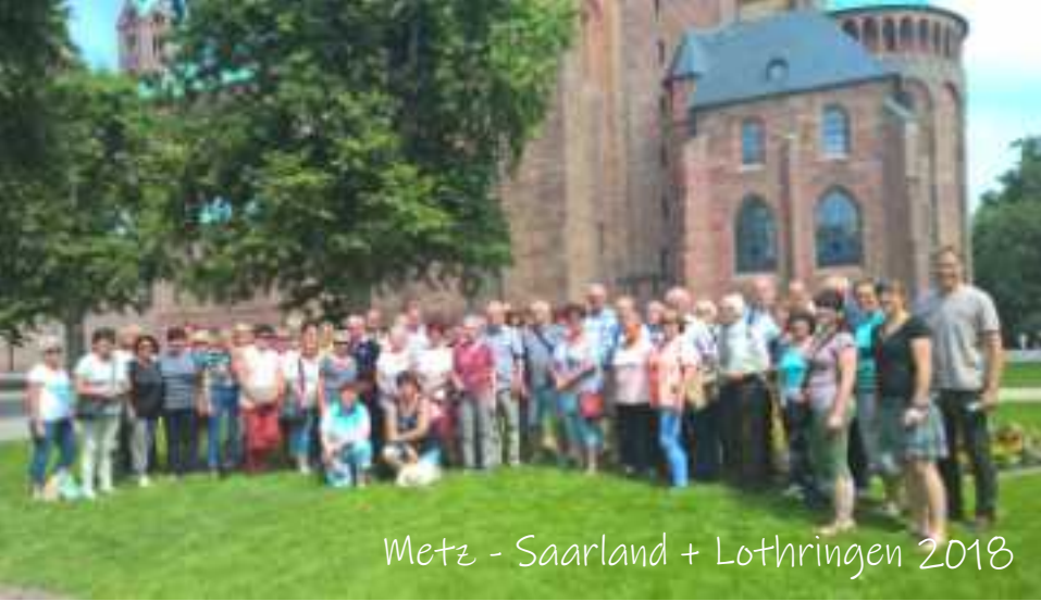
Metz - Saarland + Lothringen 2018