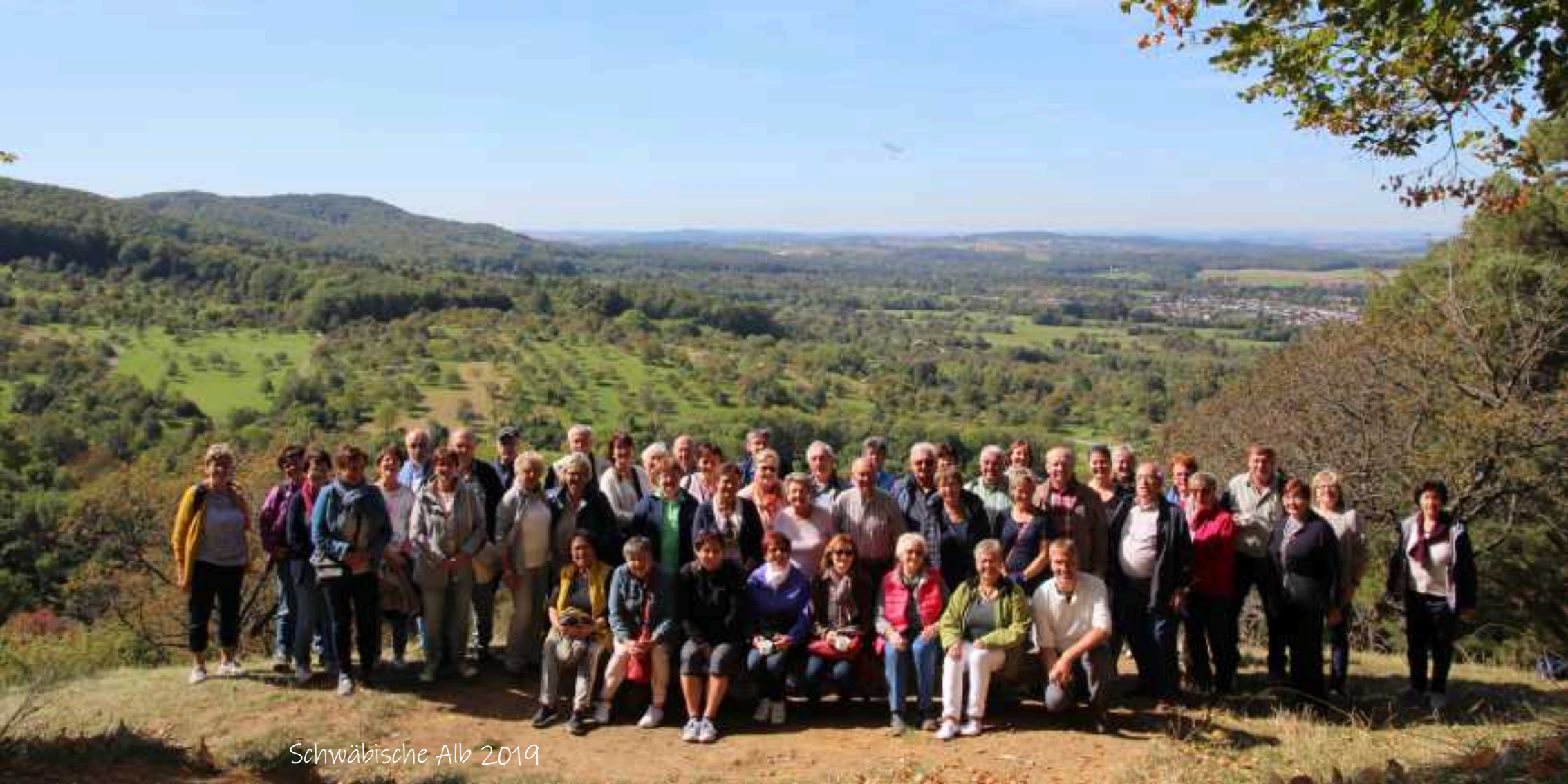
Schwäbische Alb 2019