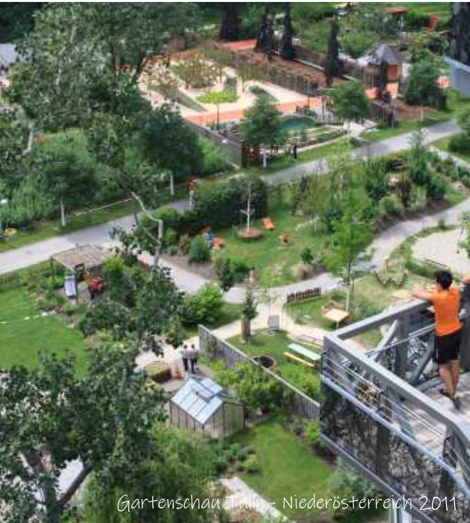
Gartenschau Tulln - Niederösterreich 2011