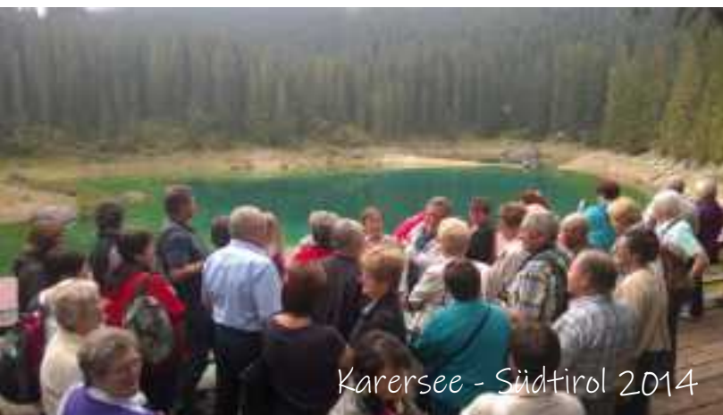
Karersee - Südtirol 2014

Alljährlich veranstaltet der Kreisverband eine 3- oder 4-Tagestour zu interessanten gärtnerischen und kulturellen Zielen in Deutschland und den Nachbarländern. Was haben wir nicht schon alles gesehen und erlebt!