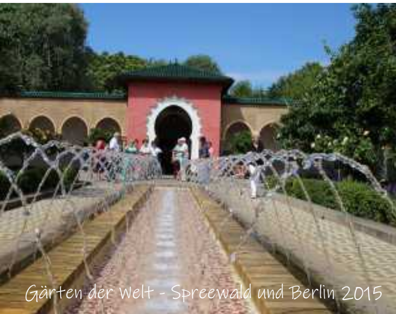
Gärten der Welt - Spreewald und Berlin 2015